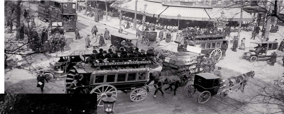
A84 - 26/08/1905